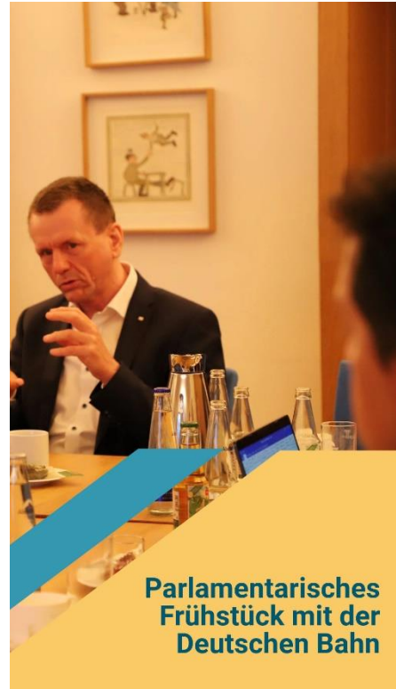
Parlamentarisches Frühstück mit der Deutschen Bahn